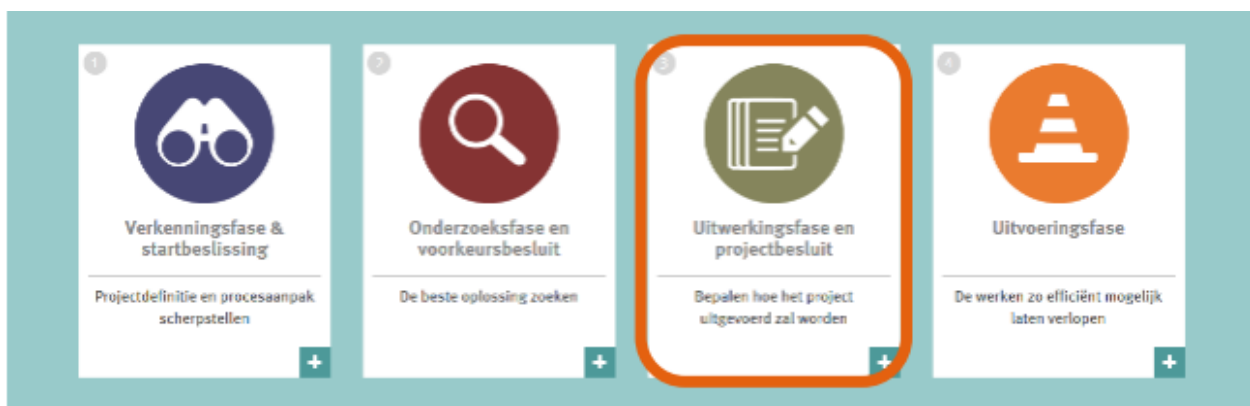
Figuur 2. Routeplanner bij complexe projecten

Nadat het voorkeursbesluit het gekozen alternatief heeft vastgelegd, volgt de uitwerkingsfase. Dit is de voorlaatste processtep binnen de routeplanner van complexe projecten voor de daadwerkelijke uitvoering van het project aanvat (Figuur 2). De uitwerkingsfase bepaalt hoe het project uitgevoerd zal worden. Het doel van de uitwerkingsfase is om het voorkeursbesluit verder te concretiseren tot een realiseerbaar project waarbij ook de uitvoeringsmethodes bepaald zullen worden.