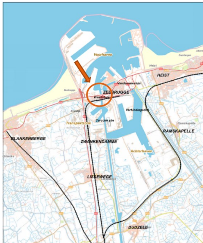
Figuur 1. Ruimtelijke situering van het project op de topografische kaart (cf. geactualiseerde projectonderzoeksnota, p. 27)

Nadat het voorkeursbesluit het gekozen alternatief heeft vastgelegd, volgt de uitwerkingsfase. Dit is de voorlaatste processtep binnen de routeplanner van complexe projecten voor de daadwerkelijke uitvoering van het project aanvat (Figuur 2). De uitwerkingsfase bepaalt hoe het project uitgevoerd zal worden. Het doel van de uitwerkingsfase is om het voorkeursbesluit verder te concretiseren tot een realiseerbaar project waarbij ook de uitvoeringsmethodes bepaald zullen worden.